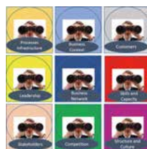
‘De 9 perspectieven van het Innovatie Framework’

Het programma voor sociale innovatie is door de ondernemer uit Zevenhoven ontwikkeld in samenwerking met TU Eindhoven en bedoeld voor werkteams in de maakindustrie. Maar het programma draait inmiddels ook bij ICT-bedrijven en zorginstellingen. “Zorginstelling Ipse de Bruggen ondergaat nu een grote sociale innovatie”, zegt hij. “Ze werkt toe naar zelforganiserende teams; een heel grote verandering waarbij op teamniveau inzicht nodig is in stimulerende factoren voor zelforganisatie.” ChangeVenture levert deze teams dat inzicht. “Dit toont aan dat sociale innovatie los staat van technologie en branche. Het is overal waar mensen samen werken in veranderende omstandigheden.”